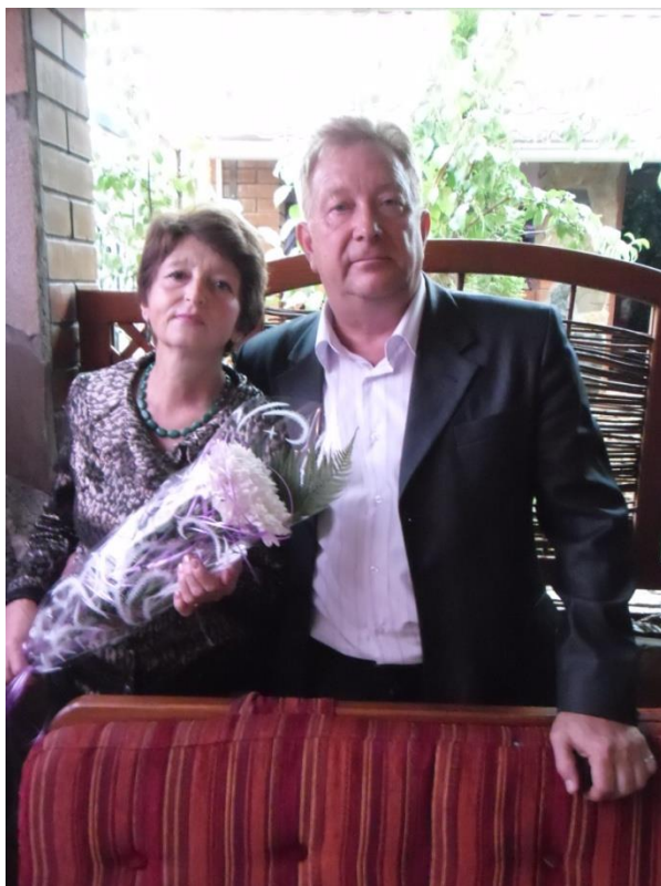
Жена. Надежда и опора.